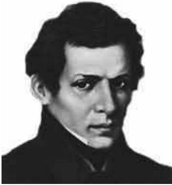
Рис. 1 – Николай Лобачевский

В первой половине XIX века по пути, проложенному Саккери, пошли Карл Гаусс, венгерский математик Янош Бойяи и российский математик Николай Лобачевский (рис. 1). Но цель у них была уже иная — не разоблачить неевклидову геометрию как невозможную, а, наоборот, построить альтернативную геометрию и выяснить её возможную роль в реальном мире. На тот момент это была совершенно еретическая идея; никто из учёных ранее не сомневался, что физическое пространство евклидово. Гаусс не решился опубликовать работу на эту тему, но его черновые заметки и несколько писем подтверждают глубокое понимание неевклидовой геометрии.